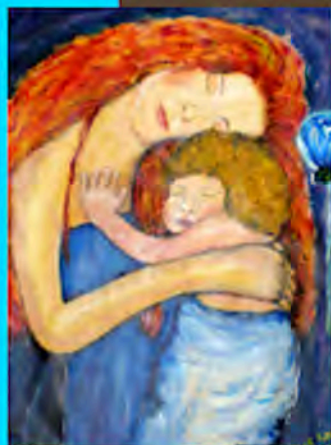
(Ik heb mij lief)