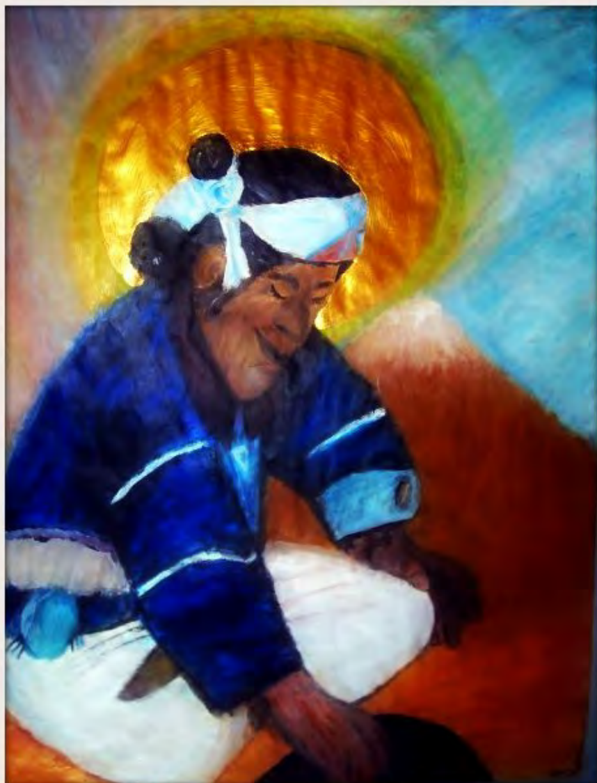
Vrijheid van Geloof